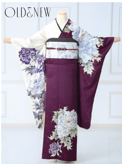
No.836 OLD&NEW 275,000円 (税込)