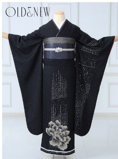
No.854 OLD&NEW 297,000円 (税込)