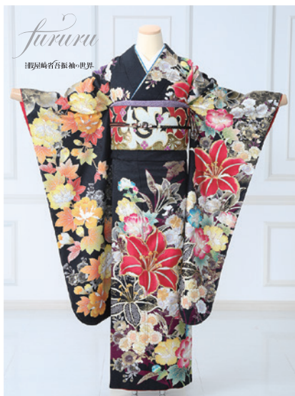
No.829 假屋崎省吾 275,000円 (税込)