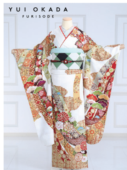
No.775 岡田結実 275,000円 (税込)