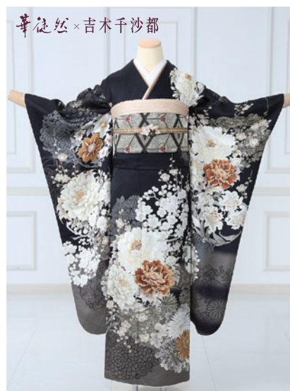
No.859 吉木千沙都 297,000円 (税込)