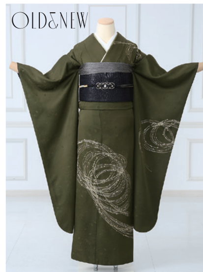
No.496 OLD&NEW 297,000円 (税込)