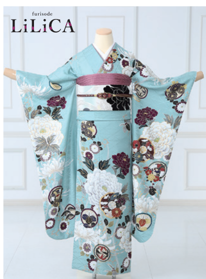
No.855 LiLiCA 297,000円 (税込)