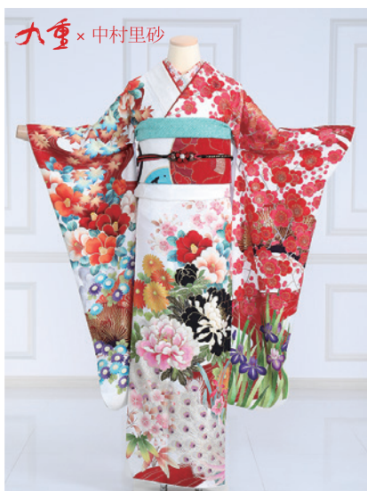
No.789 中村里砂 275,000円 (税込)