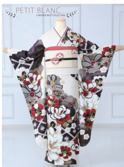
No.849 PETIT BLANC 275,000円 (税込)