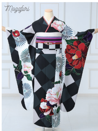
No.845 Mogafuri 250,000円 (税込)