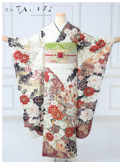
No.863 ひいな 275,000円 (税込)