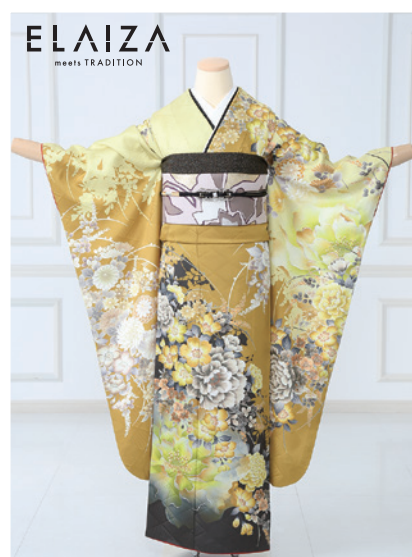
No.857 ELAIZA 297,000円 (税込)