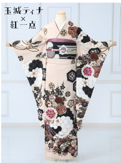
No.828 玉城ティナ 275,000円 (税込)