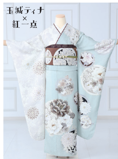
No.481 玉城ティナ 275,000円 (税込)