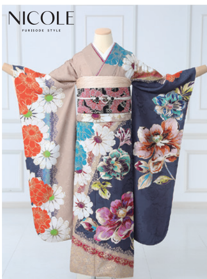
No.852 NICOLE 275,000円 (税込)