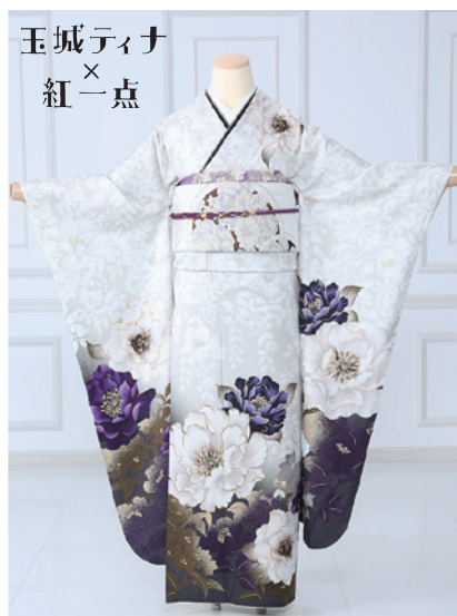
No.482 玉城ティナ 275,000円 (税込)